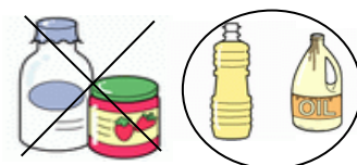
ビン類 プラスチック製ボトル

【問合せ先】 小牧市役所 環境対策課 環境政策係 TEL 0568-76-1181 FAX 0568-72-2340 e-mail kankyuu@city.komaki.lg.jp