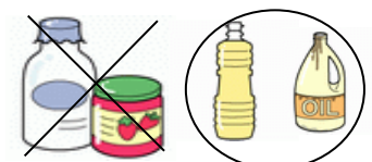
ビン類 プラスチック製ボトル

【問合せ先】 小牧市役所 カーボンニュートラル推進課 環境政策係 TEL 0568-76-1181