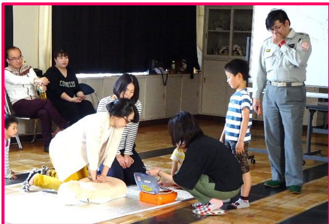
【親子救急救命講座】