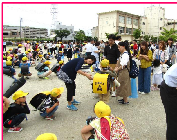
【緊急時引き渡し訓練】