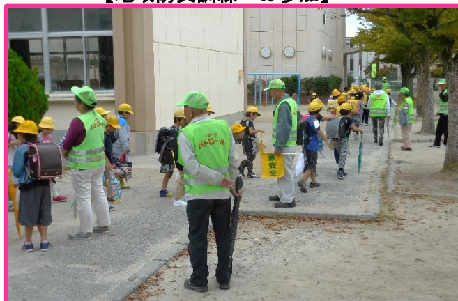
【通学路パトロールボランティアの見守り】