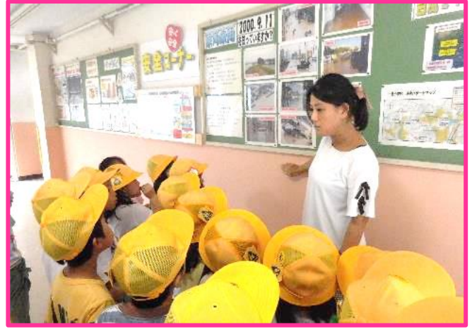
【安全意識を高める掲示物①】