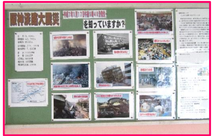
【安全意識を高める掲示物③】