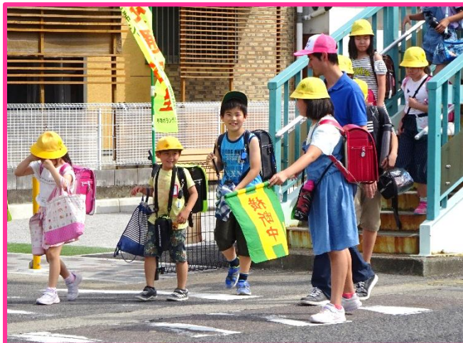
【通学団旗使用指導】