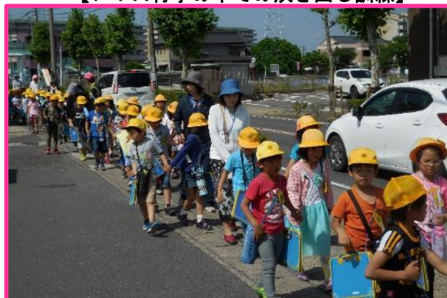
【学校サポーター 校外学習時の安全指導補助】