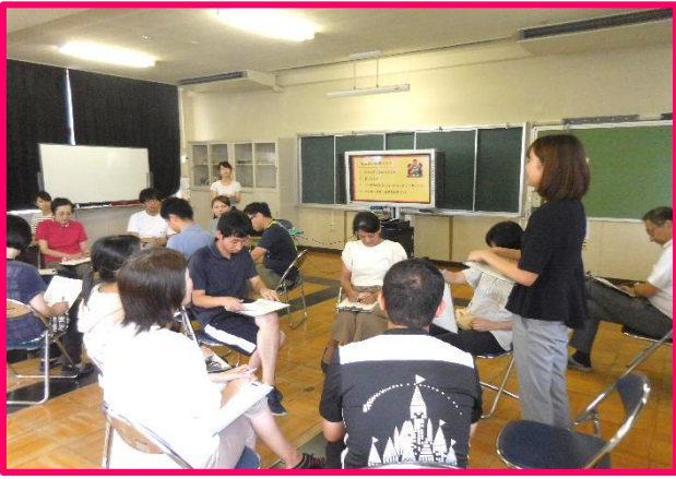
【教職員緊急時シミュレーション研修】