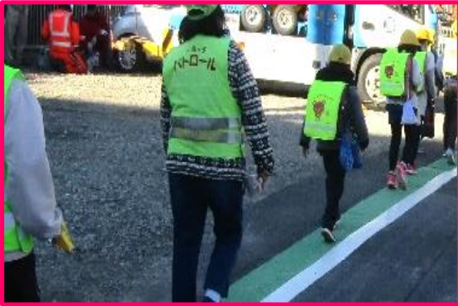
【通学路への新たなみどり線の設置】