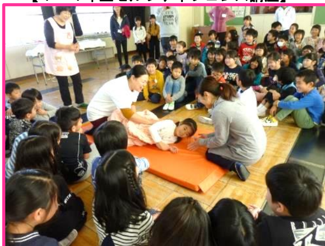
【2年生いのちの授業～生と性のカリキュラム～】