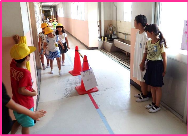
【生活安全委員会 廊下歩行改善の取組】