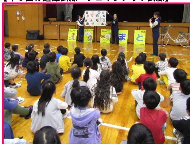
【2・5年生交通安全教室】