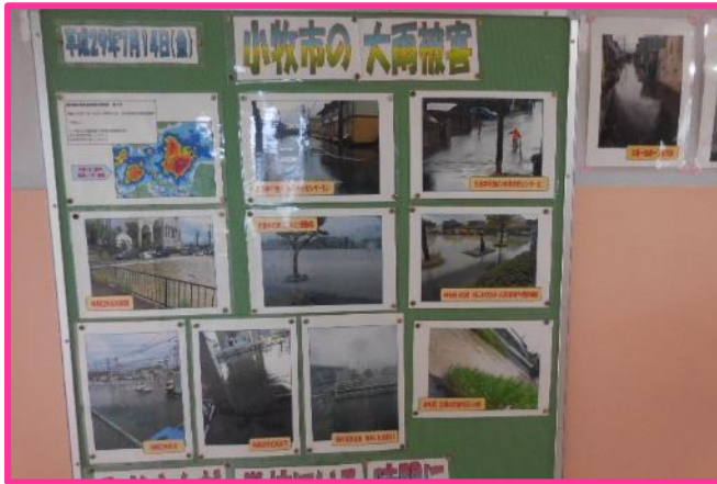
【安全意識を高める掲示物②】