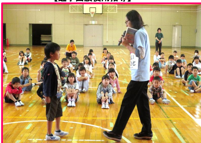
【1・4年生セルフディフェンス講座】