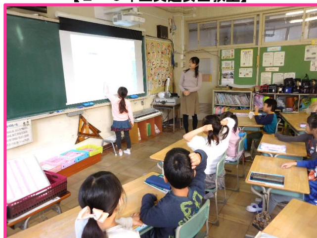
【月1回の危険予知トレーニング】