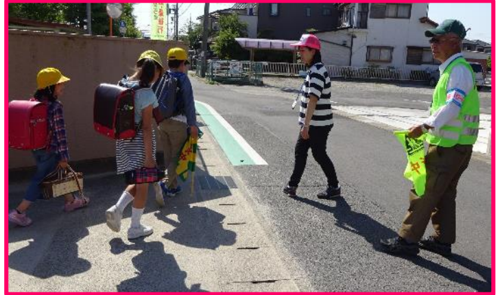
【緊急情報広域ネットワーク活用訓練】