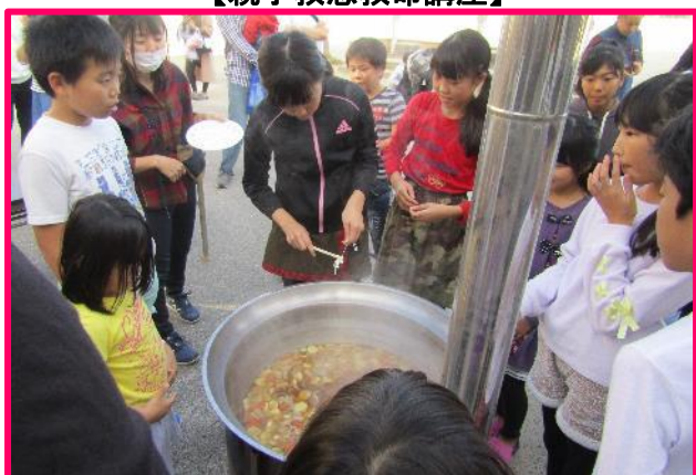
【PTA行事の中での炊き出し訓練】