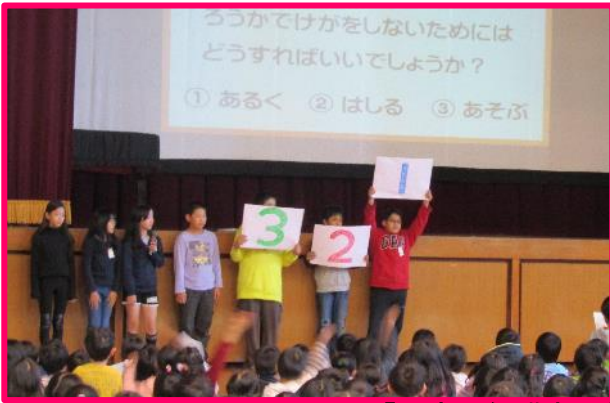
【児童・保護者・教職員で考える学校保健委員会】