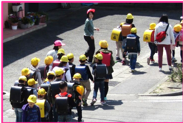
【児童とともに通学路点検】