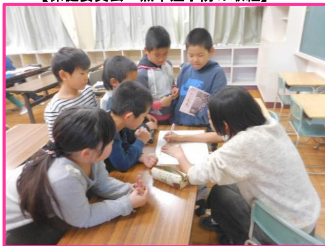
【児童も参加する校区安全マップづくり】