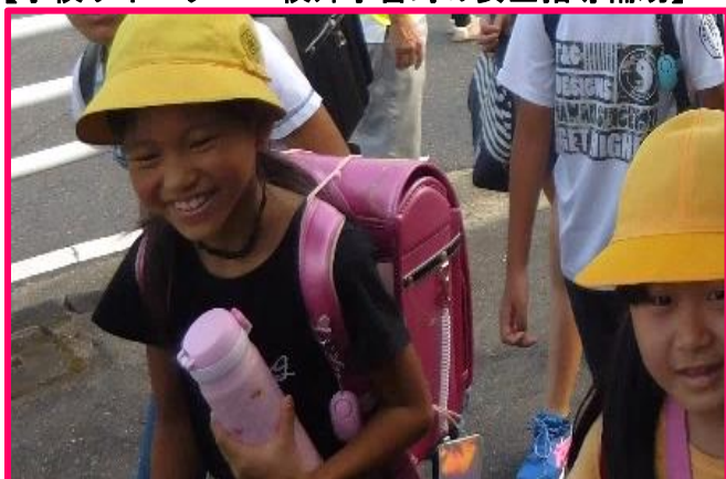
【保護者・地域による登校の見守り】