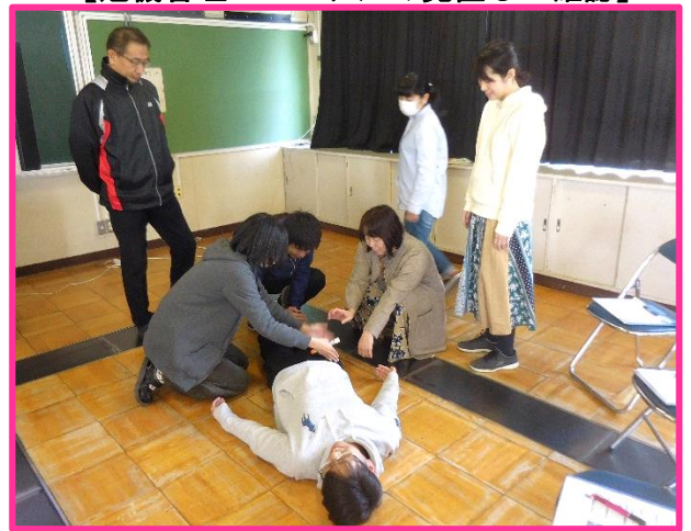
【教職員エピペン研修】