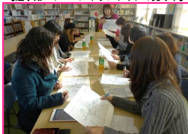
【保護者も参加した校区安全マップづくり】