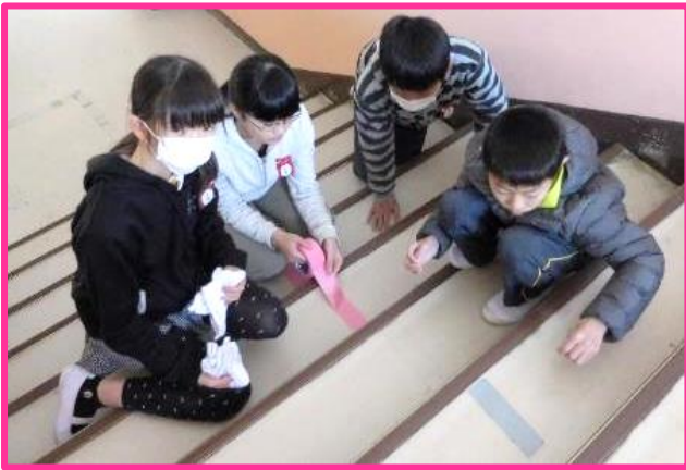
【廊下のセンターテープ貼り付け】