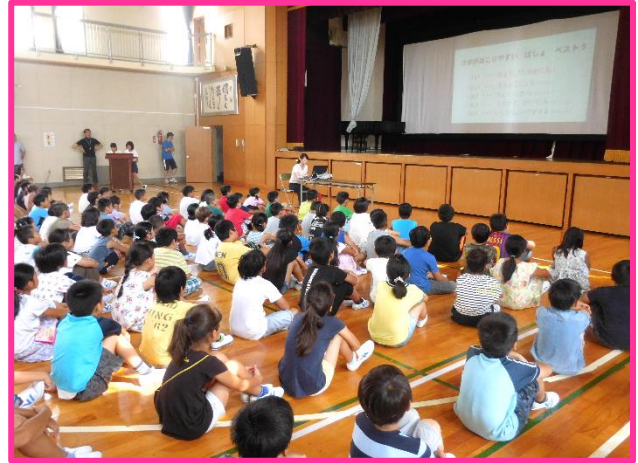
【保健委員会 校内のけが削減の取組】