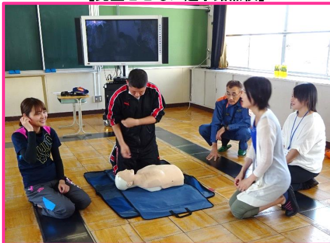
【教職員救急救命研修】