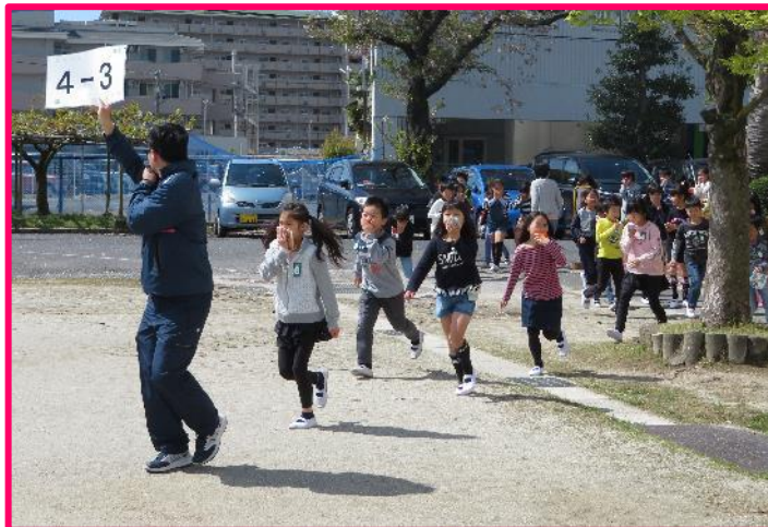
【年6回の避難訓練・シェイクアウト訓練】