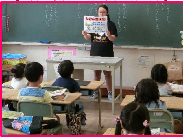
【保健委員会 熱中症予防の取組】