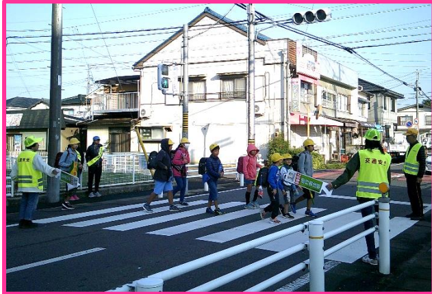
【街頭事故防止活動】