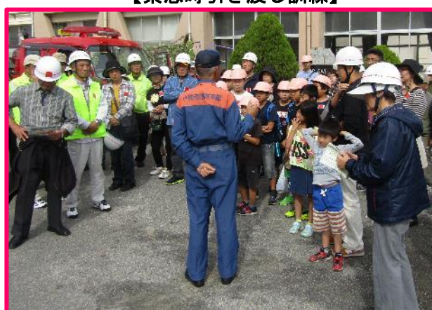
【地域防災訓練への参加】