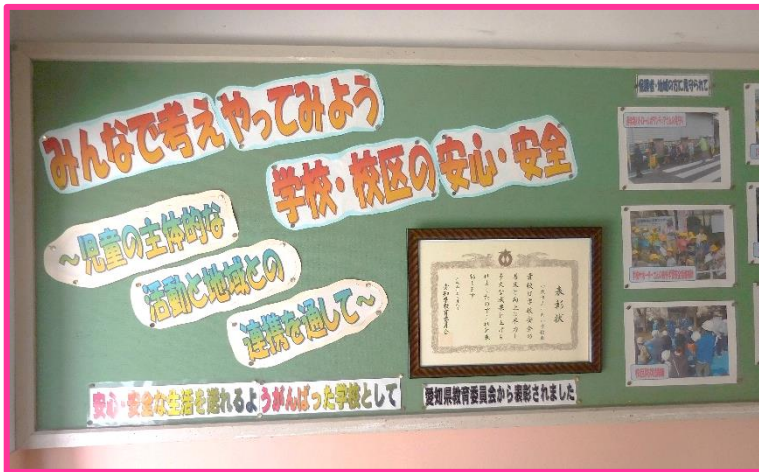
【平成29年度愛知県学校安全優良校として表彰されました】

安心・安全な学校・ 校区づくりに向けて、 これからも取り組み を進めていきます。