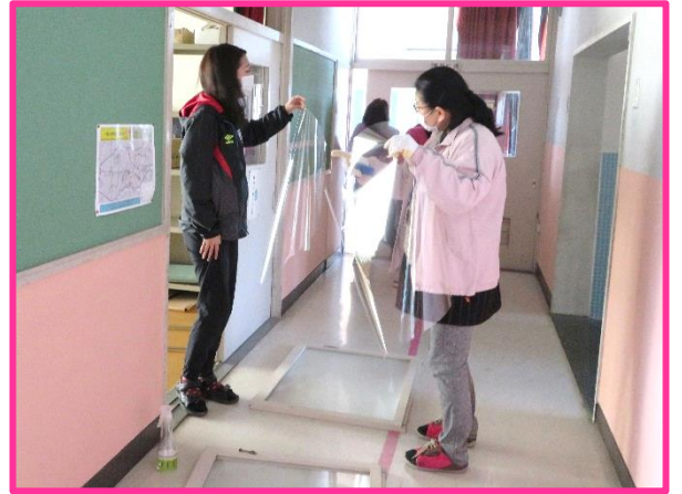
【飛散防止フィルム貼り付け】