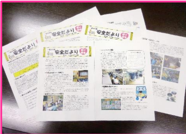
【安全だよりの発行】