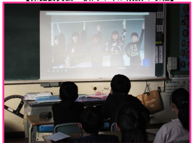
【保健委員会 けが防止啓発ビデオ作成】