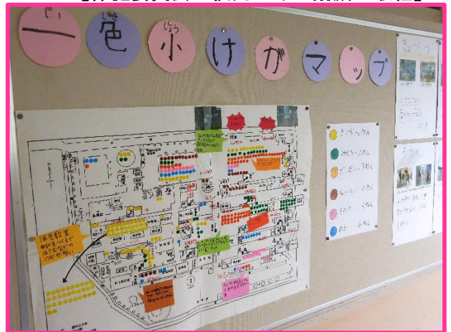
【保健委員会 校内のけが削減の取組】