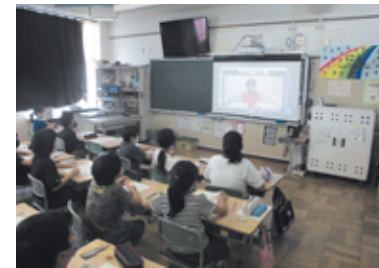
オンラインでの校外学習