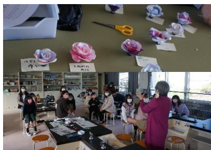
アロマ&フラワーアート

原っ子サタデースクールを10月30日(土)に開催しました。今年度は、昨年までの「3Dアート」「ミニ四駆」「バルーンアート」「ラダーゲッター」に「ストロー鉄砲」と「アロマ講座」を加え6つの講座を開催しました。子ども・保護者を合わせて129名の参加がありました。親子で一緒にリースやミニ四駆を作ったり、ボールを投げて、一喜一憂したりと、日頃できないような体験を楽しみながら、有意義な一日となりました。