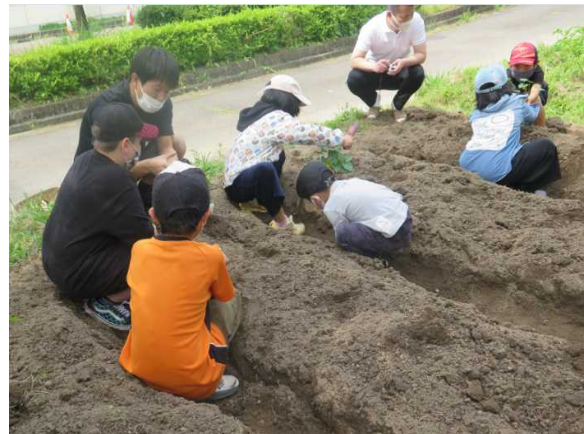
【野菜の苗を植えました】