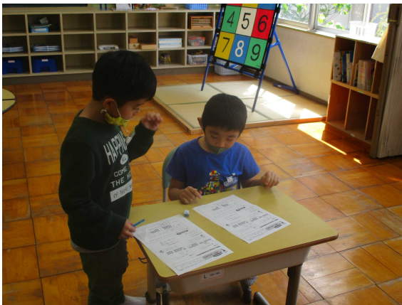
【なかよく学習に取り組みました】