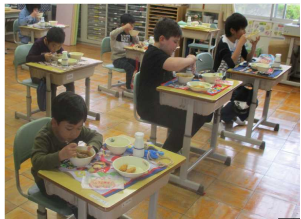
【おいしく給食を食べました】