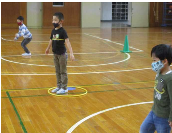
【レクリエーションで交流を深めました】