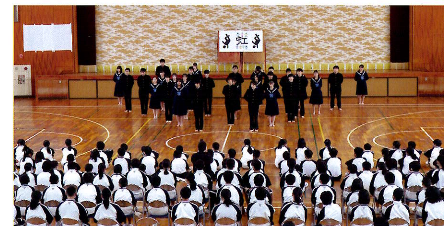
西中祭(秋)パフォーマンス大会