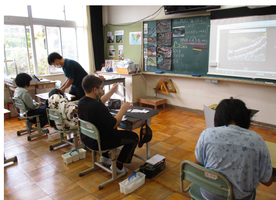
図工競技会のようす