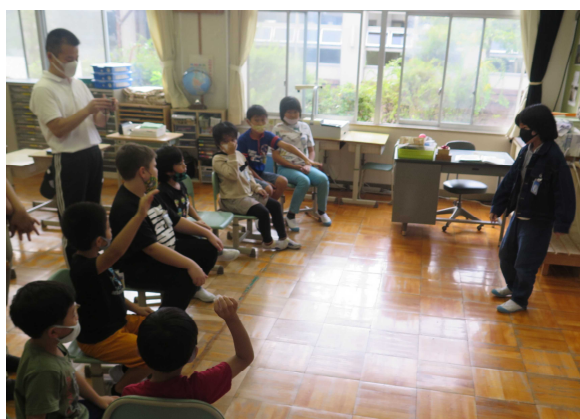
みんなでレクリエーション！